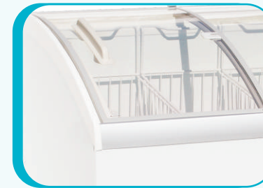
PUERTAS DE VIDRIO DESLIZABLES