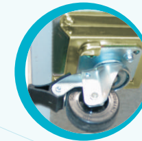
RUEDAS CON FRENO OPCIONAL