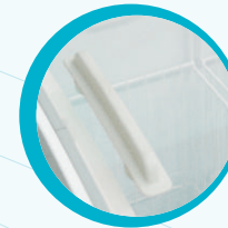
PUERTA CON JALADERA EN EL CRISTAL