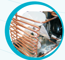
CONDENSADOR AUXILIAR DE BAJO MANTENIMIENTO