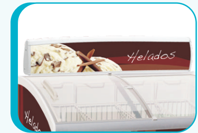
COPETE PROMOCIONAL OPCIONAL